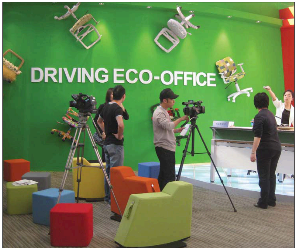
Office environment theme pavilion: aktivitet i medierommet – demonstrasjon av videokonferansesemuligheter

mobelfakta.no, noe som forutsetter at bedriften innen utgangen av 2010 igangsetter prosessen med miljøsertifisering av bedrift, og miljø- og kvalitets- sertifisering av egenproduserte produkter. Svenheim har allerede kvalitets- sertifisert egne produkter etter Møbelfaktas kvalitetskriterier i flere år, og har også igangsatt prosessen med innføring av internt miljøstyringssystem i form av den nasjonale standarden Miljøfyrtårn. I løpet av førstkomende høst starter bedriften også prosessen med å miljødeklare egne produkter i form av EPD (Environmental Product Declaration). Det er derfor et poeng for Svenheim at eventuelle underleverandører også er miljøsertifisert og at produktene deres også er det. Men det er det ennå ikke mange leverandører eller produkter på det enorme kinesiske markedet som er. Etter gjennomgang av 10 messehallen i løpet av to dager har Anders og Are funnet to leverandører som har dokumentasjon på ISO 14 001 sertifisering hengende til utstilling