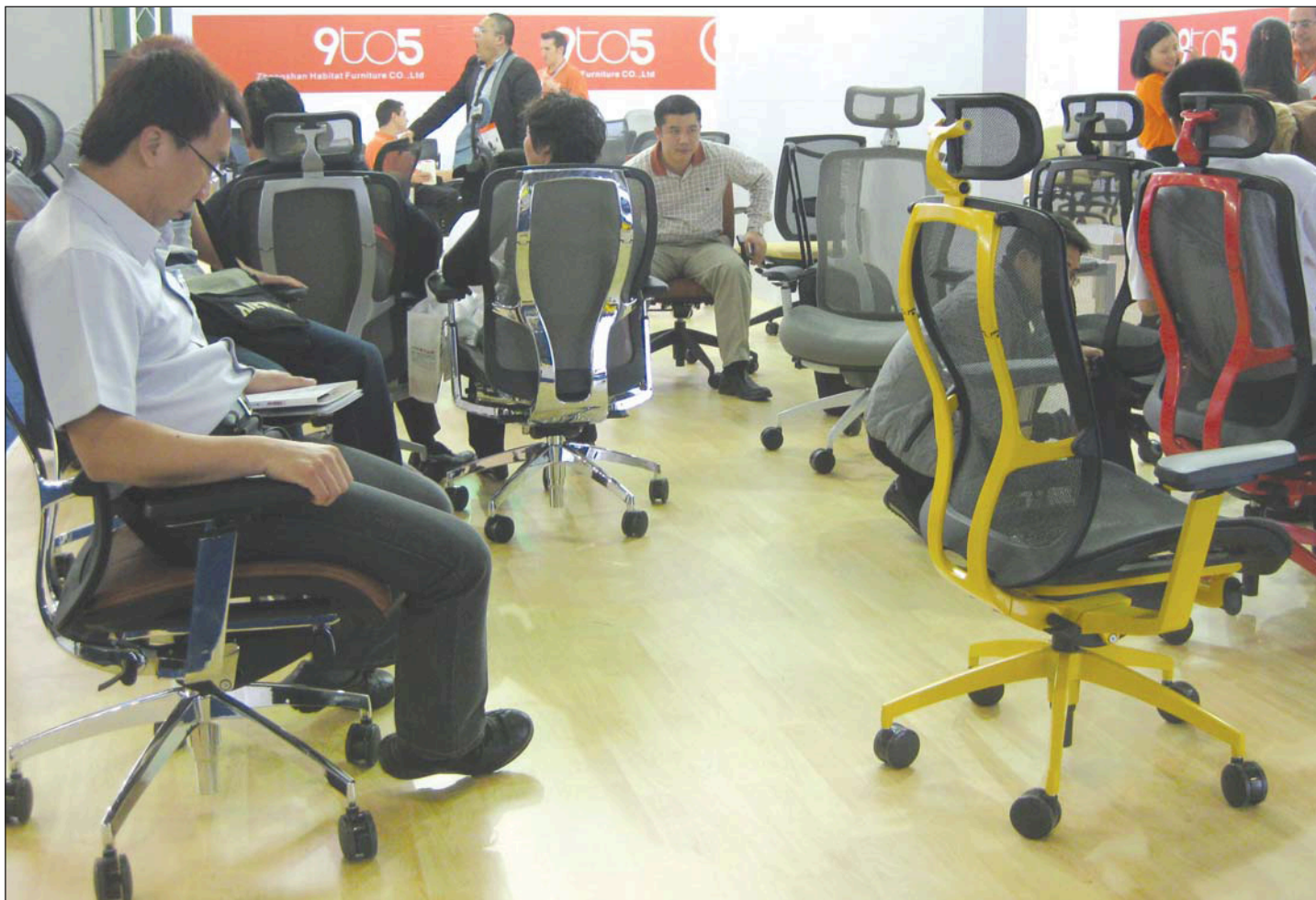
Testing av kontorstoler kos kinesisk leverandør

på egen messestand, eller fremmet dette i eget markedsmateriell.