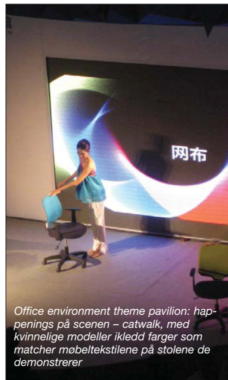
Office environment theme pavilion: happenings på scenen – catwalk, med kvinnelige modeller ikledd farger som matcher møbeltekstilene på stolene de demonstrerer

I ett intervju med Liu Xianming - President of the Guangzhou Furniture